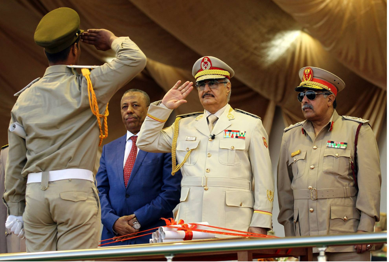
(المشير خليفة حفتر