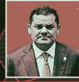
عبد الحميد الدبيبة

رئيس حكومة الوحدة الوطنية الرئيس السابق للمجلس الأعلى للدولة