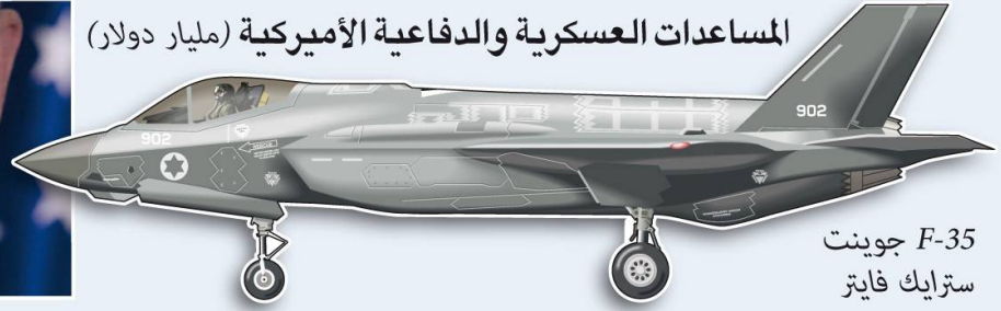
F-35 جوينت سترايك فايتر