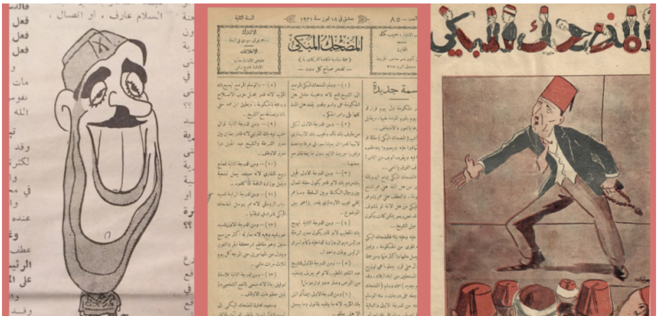
"غلاف لمجلة "المضحك المبكي"

أولى أهداف المجلة كان رئيس الحكومة تاج الدين الحسني أثناء المعركة حول دستور سوريا الجمهوري الأول سنة 1928. صارت "المضحك المبكي" تضع رسم الشيخ تاج على كل غلاف، وكان سهل التناول من حيث الشكل، نظراً لقصر قامته وبدانته واللفة البيضاء التي كان يضعها دوماً فوق رأسه. في إحدى الرسومات أظهرته المجلة في مواجهة مع النائب الوطني فخري البارودي الذي يقول له: "أما حان الوقت لك أن تتنحي؟"، ويجب الشيخ تاج: "أبداً، لن أرحل إلا بأمر من المندوب السامي الفرنسي".